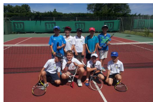
Catégorie 10 ans Vert