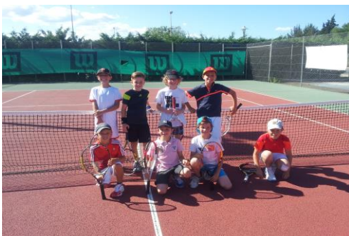
Catégorie 9 ans Orange